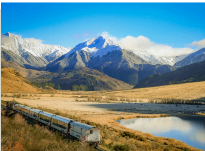
高山觀景火車 Tranz Alpine

西地國家公園： 南島的西海岸波瀾壯闊，伴隨著南阿爾卑斯山脈美景不斷，有奇特的溫帶雨林及成千的海鳥聚集山丘上。