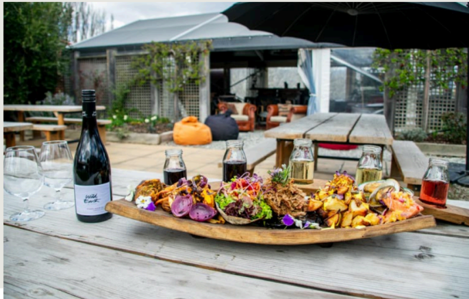
The Stoker Room

來到南緯45度，一定要品嚐當地的葡萄酒，地形、氣候、日照相輔相成下結合的絕世美味；酒酣之餘，配著用葡萄酒桶煙燻、烤製的烤肉，一口酒，一口肉，把平常堆積的疲勞與煩惱拋諸腦後。