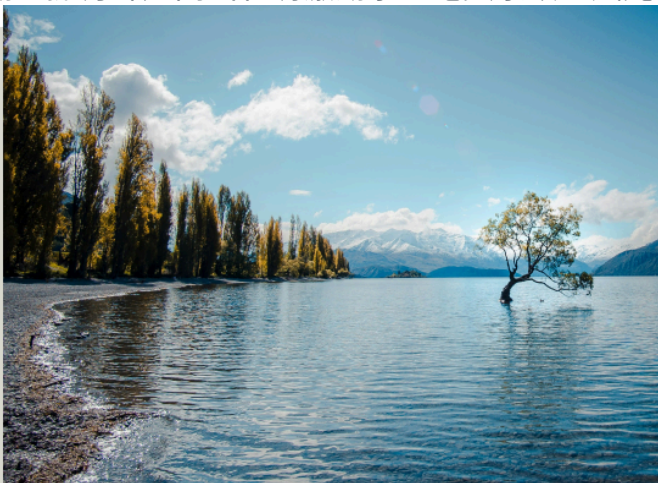
瓦納卡湖 Lake Wanaka

瓦納卡 ：依山傍水的瓦納卡，其向後倚靠亞斯彼靈國家公園，旁邊則是紐西蘭第四大湖 - 瓦納卡湖，擁有綿延高山和清澈湖水的絕美景致，風光明媚媲美皇后鎮，是當地人首選的度假勝地。