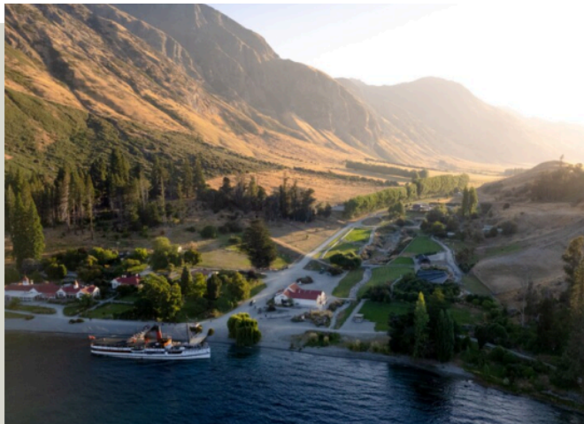
沃爾特峰農莊 Walter Peak High Country Farm

皇后鎮 ：四周環繞著高達2000公尺的里馬克伯山脈與坐落於其間的瓦卡提普湖，美景天成，脫俗雅致，有如仙境般的秀麗景緻。19世紀中葉，來自世界各地的淘金客在偶然的機會下發現此地，不禁讚嘆「這裡是最適合皇后居住的地方！」因而得名。