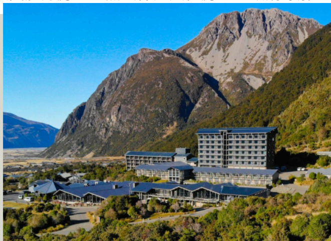
庫克山隱士飯店 The Hermitage Hotel

爛的星空。本行程安排入住於庫克山區域的隱士集團飯店，讓您體驗絕美的山景風貌，飯店住宿以團體訂房，恕無法保證入住房型，敬請瞭解。