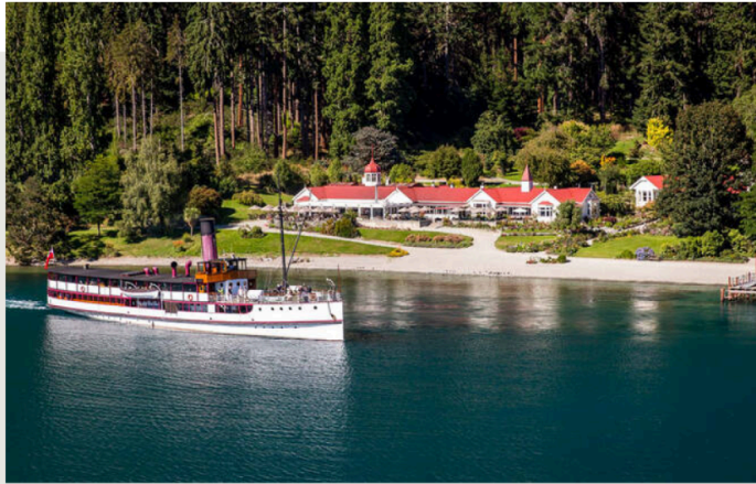
Walter Peak High Country Farm

搭乘二戰時期的百年蒸汽郵輪來到沃爾特峰農莊，一邊觀賞湖邊花園，一邊享用紐西蘭式的烤肉。飯後在農莊內散散步，與農莊內的羊群們互動，又是一個悠閒的午後。