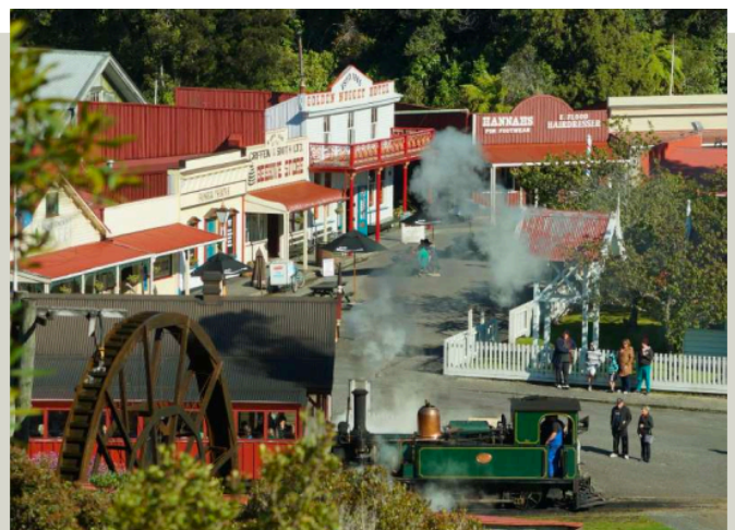
淘金小鎮 - 仙蒂鎮