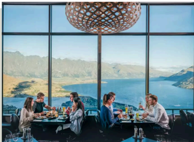
山頂景觀餐廳 Skyline Restaurant