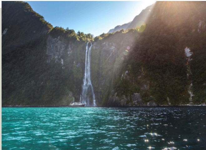
米佛峽灣 Milford Sound

米佛峽灣遊艇巡弋 : 專車行走在世界著名的觀景公路上，公路兩側覆蓋著茂密的原始溫帶雨林，整個峽灣地帶也是紐西蘭野生動物的棲息處，260萬公頃的區域在1990年已列入世界自然遺產保護之列。從冰河時期到現今形成的峽灣面貌，國家公園三分之二的土地上覆蓋住紐西蘭原始山毛櫸和羅漢松為主的植被，接著我們將搭乘郵船遊覽米佛峽灣，豐沛的雨量讓沿途陡峭的高山上常常出現間歇性瀑布，如天氣多雨，甚至可同時看到上千條瀑布，使峽灣國家公園的自然景觀一年四季都充滿與眾多國家公園不同的美景。*備註：若遇雪崩或道路封閉等不可抗拒之因素，則安排退費為替代。