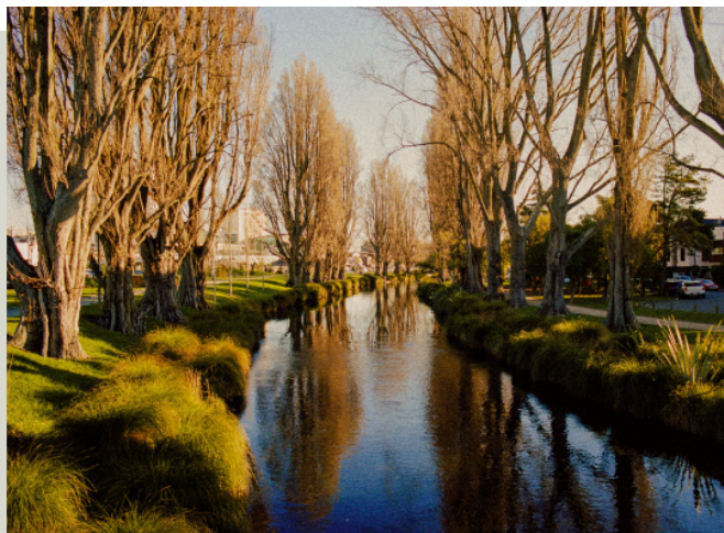
雅芳河 Avon River