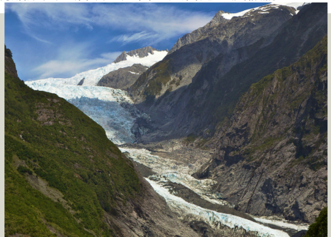
西地國家公園 Westland National Park