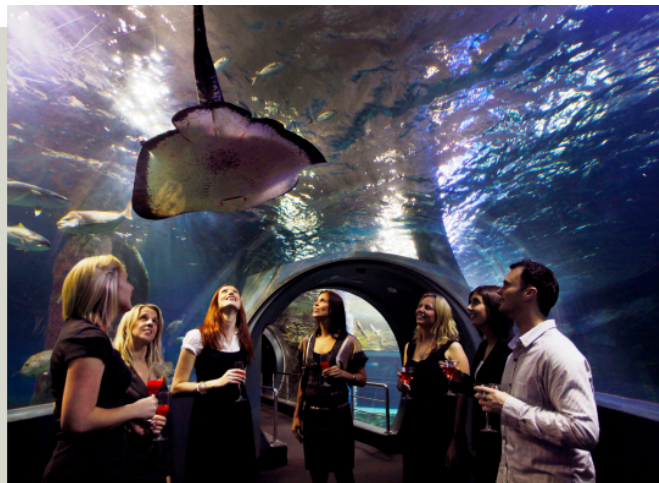
凱莉達頓水族館 Kelly Tarltons Aquarium