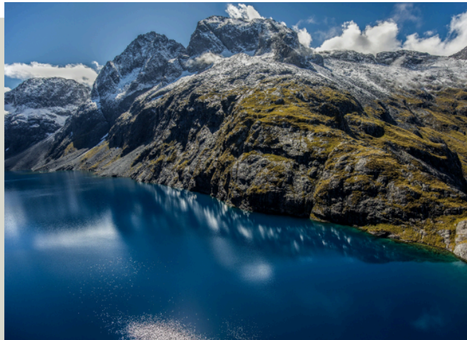
峽灣國家公園 Fiordland National Park