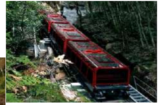
箱型纜車 ，可欣賞明地板的特殊造型種纜車臨時故障或

【 藍山國家公園 BLUE MOUNTAINS NATIONAL PARK 】 2000 年被聯合國科教文組織登錄為世界自然遺產 ，素有澳洲大峽谷之稱。「藍山」之名源自於因園內在陽光照射之下，整座山脈繚繞在一片淡藍色的氣息之中。園內地質因沈積隆起和火山運動後，再經過經年累月風雨侵蝕，造就了奇岩、峽谷、瀑布等壯闊秀麗的地形景觀。